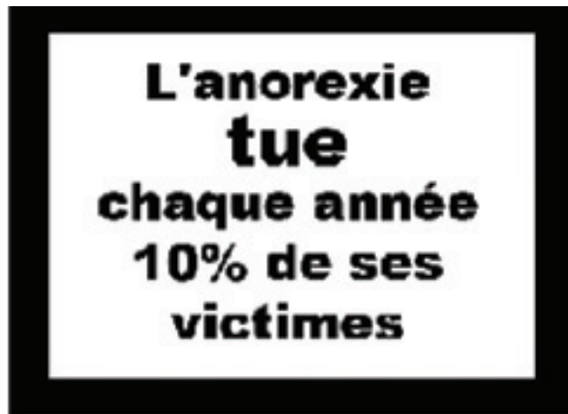
Sur Internet, la bataille entre les pro et les anti-ana fait rage.

Oui je le prends très au sérieux car on voit les dégâts. Plusieurs pro ana sont déjà mortes. Ce mouvement, qui part d'un culte de la minceur poussé à l'extrême, est pour moi un genre de secte (d'ailleurs les pro ana ont des bracelets en signe de reconnaissance). Des gamines de 12/13 ans veulent devenir pro ana, est-ce normal ? Non, il faut agir.